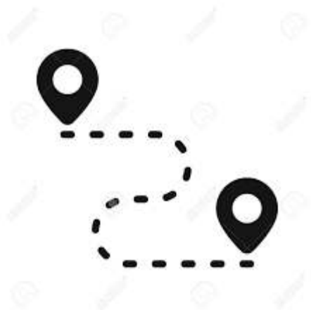
3 itinéraires testés (ViaRhôna, GTMP, Les Rochettes)