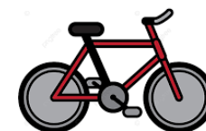
3 outils de mobilité (VTTAE, 3 ème roue, quadrixe)