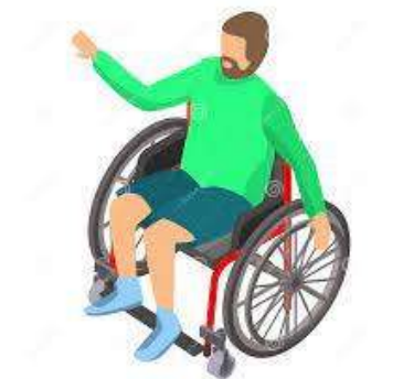
6 participants (1/2 vivant sur le territoire)